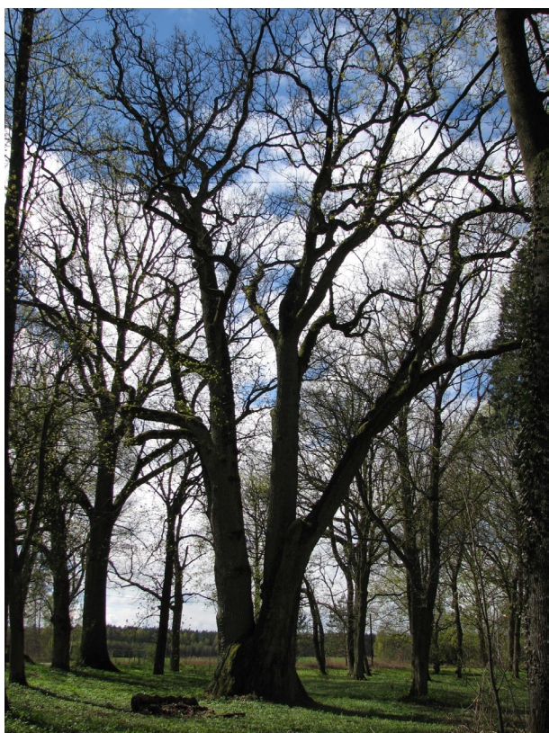
Fot. 1. Najgrubszy pomnik przyrody w Nadleśnictwie Lipka – dąb szypułkowy o obwodzie 715 cm w zabytkowym parku dworskim w Małym Buczku

Photo 1. The thickest natural monument in the Lipka Forest District – an English oak with a circumference of 715 cm in the historic manor park in Mały Buczek