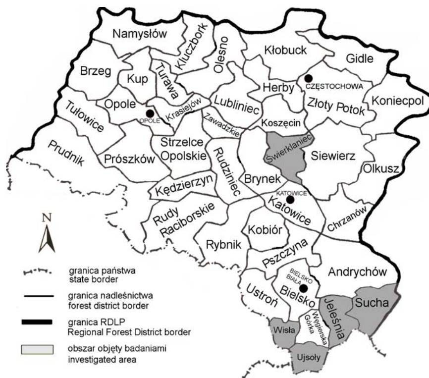
Rys. 2. Nadleśnictwa objęte badaniami, należące do Regionalnej Dyrekcji Lasów Państwowych w Katowicach